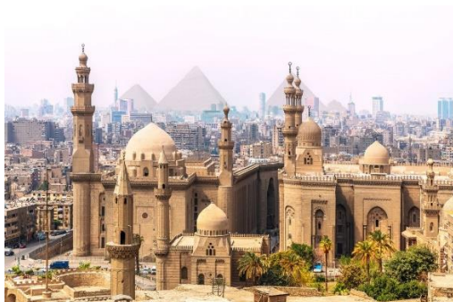
Cairo Città Vecchia

Dopo la prima colazione visita delle celeberrime piramidi di Giza e dell'enigmatica Sfinge. Dopo il pranzo proseguimento della visita a Memphis e Saqqara. Cena e pernottamento in hotel.