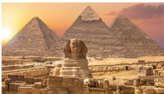
Cairo Piramidi e Sfinge

Dopo la prima colazione, escursione in feluca sul Nilo e visita alle dighe di Aswan: la Grande e la Vecchia. Pranzo al sacco e trasferimento in aeroporto e partenza per il Cairo. All’arrivo incontro con l’assistenza e trasferimento in hotel per l’assegnazione delle camere riservate. Cena e pernottamento.