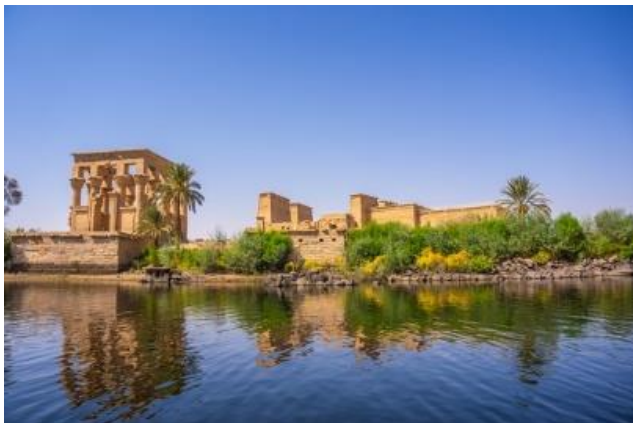
Aswan Tempio di Philae

Prima colazione a bordo. Al mattino visita al tempio di Horus ad Edfu. Navigazione verso Kom Ombo. Pranzo a bordo. Nel pomeriggio visita ai Templi dedicati Sobek ed Haroeris. Navigazione verso Aswan. Cena e pernottamento. In serata “Galabeya Party” a bordo