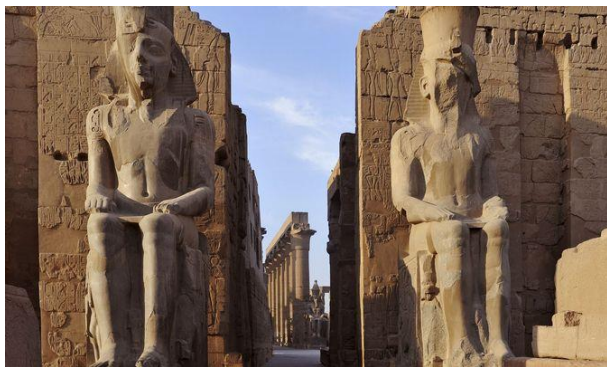
Luxor –Tempio di Karnak

Partenza da aeroporto di Verona con volo diretto per Luxor. Arrivo all'aeroporto di Luxor e incontro con l'assistente, disbrigo delle formalità doganali e trasferimento a bordo della motonave. Check In per l'assegnazione delle cabine riservate. Cena e pernottamento